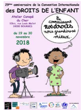
Affiche OCCE 18 : Patrick Soulat

Si possible, vous pouvez imprimer l'image (page 1) ou la projeter au groupe.