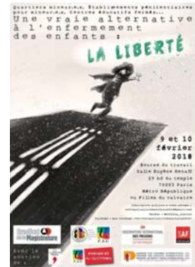
Observatoire des Prisons

Si possible, vous pouvez imprimer l'image (page 1) ou la projeter au groupe.