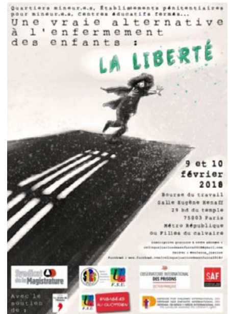
Observatoire des Prisons